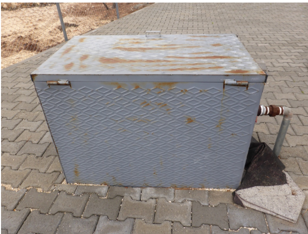
Vorläufige Ansicht des Brunnens

Danke an alle, die mitgeholfen haben. Damit helfen dieses Jahr die Erträge aus der Landwirtschaft, Kurse für Mädchen zu finanzieren .